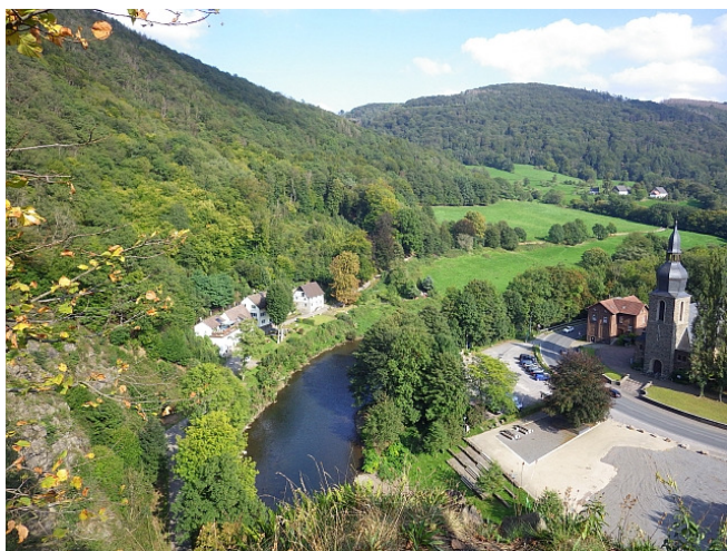
Die Lenneschleife an der Dümplerleie