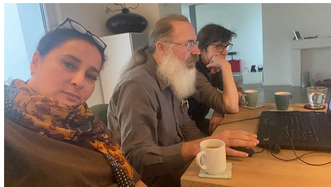
Die vor Ort anwesenden Mitglieder