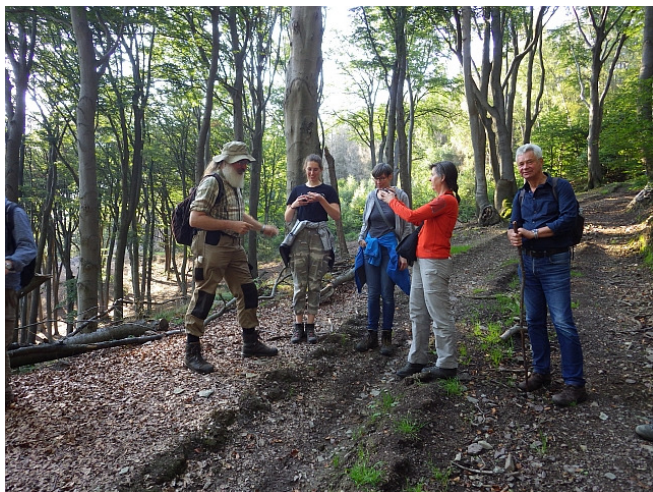
Einige Teilnehmer in den Haubergwäldern

Der Rückweg führte durch alte Haubergwälder; das sind zur Brennholzgewinnung immer wieder auf den Stock gesetzte Hain- und Rotbuchenbestände (bis etwa 1950 praktiziert).